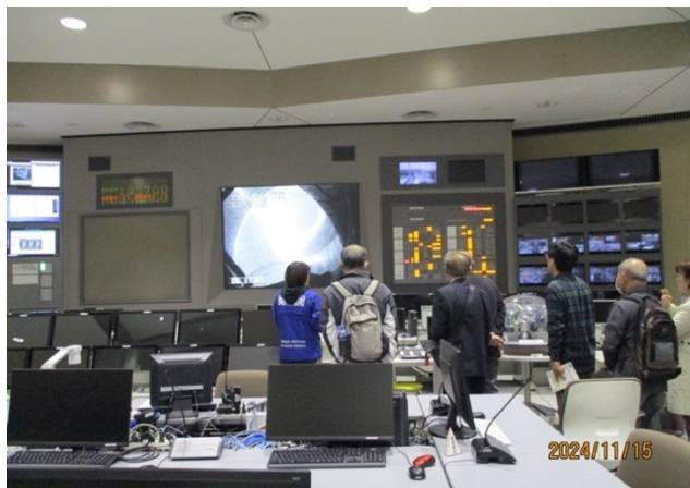
実験制御室内の見学