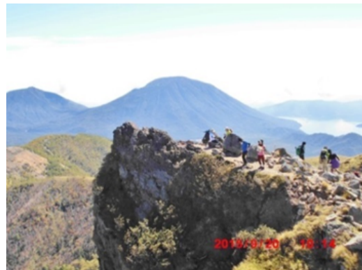
奥白根山頂上から男体山、中禅寺湖