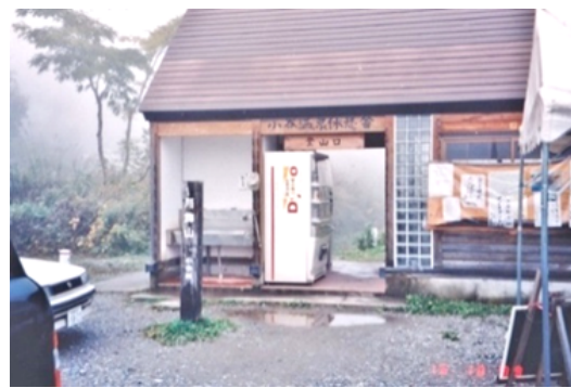
小谷温泉側の登山口