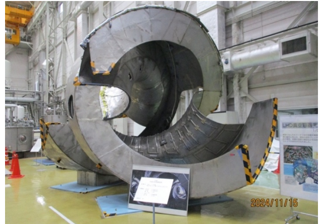
核融合装置の実物大モデル