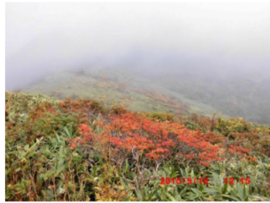
カミナリ清水付近の紅葉