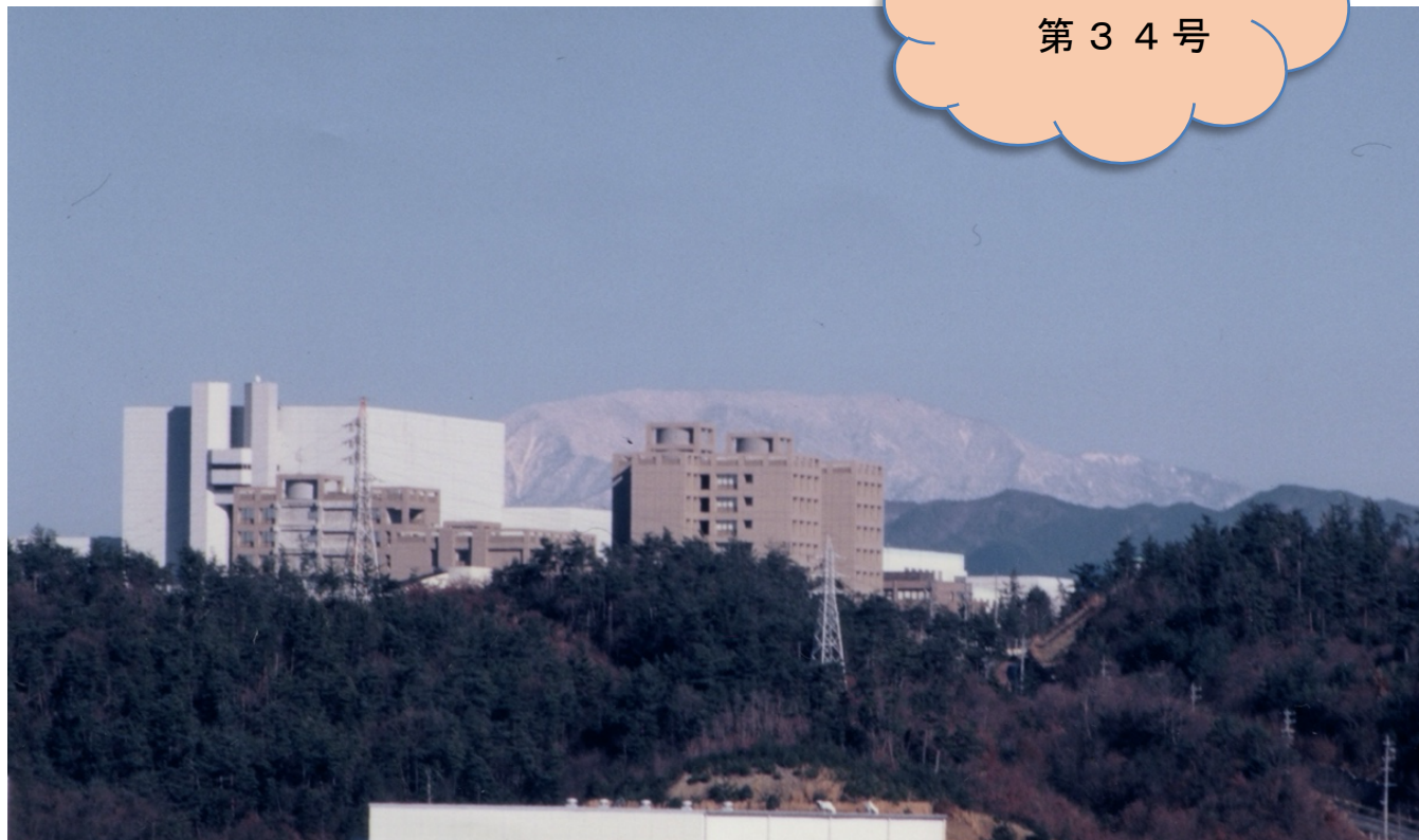
【写真】 核融合科学研究所と雪の恵那山 (吉田会員撮影)