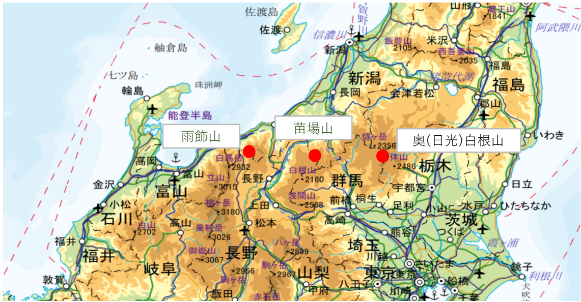
国土地理院地図（電子国土Web）を加工

今回紹介する 31雨飾山と32苗場山は信越国境、37奥(日光)白根山は日光国立公園にある山です。雨飾山は天気が悪かった山で、苗場山と奥白根山は途中下山した山です。途中下山したこの2山は二泊三日で再登山しました。