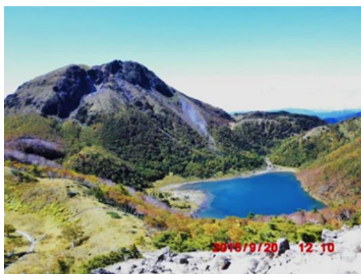
前白根山中腹から奥白根山