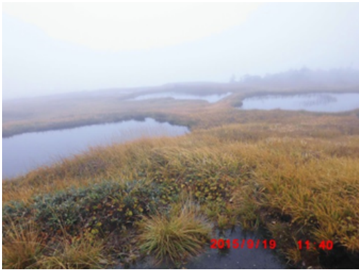
苗場山山頂部の池塘