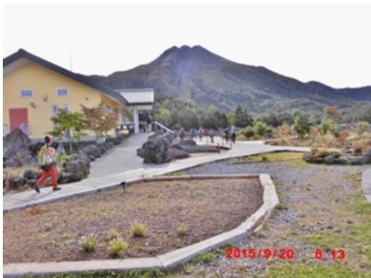
丸沼ロープウェイ頂上駅から