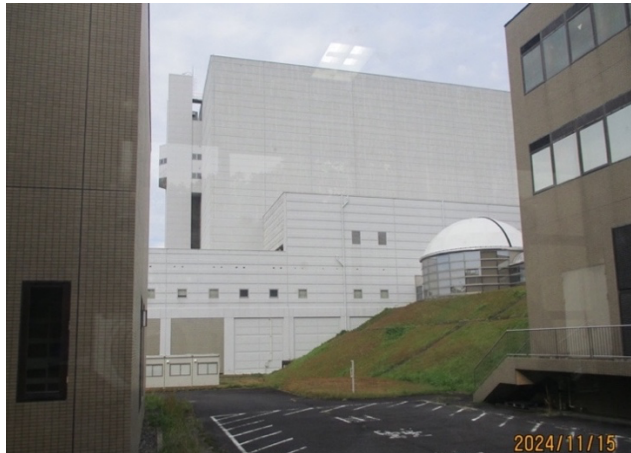
大型ヘリカル装置実験棟（奥の四角の建物）